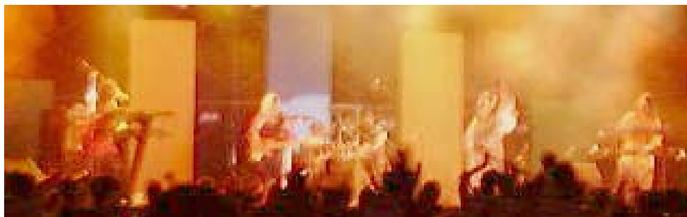
「舞台イメージ」 ※参考イメージです

大ホールである音楽センターの収容員数（固定席 1,932 席）を生かした興行的なコンサート、ライブ等にご利用いただけます。大規模な舞台セットをお考えの際には、構造上低く抑えられている舞台の高さ（最大約 9m）にご注意ください。