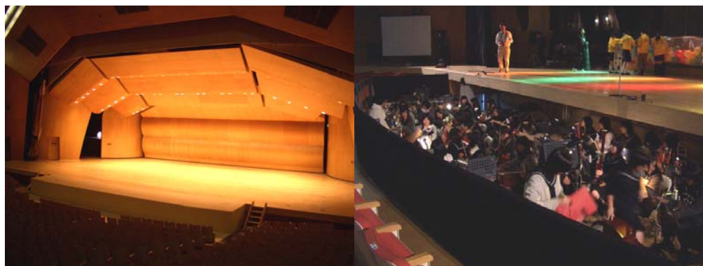
エプロンステージ