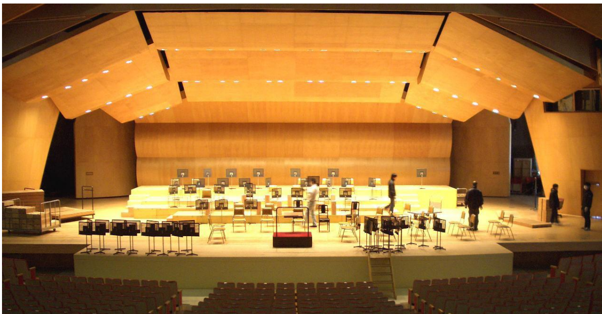
「舞台イメージ」 ※写真はエプロンステージ(別料金)がセットされています、ご参考まで