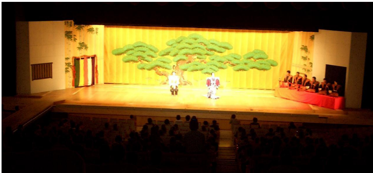
「舞台イメージ」 ※所作台、本花道等セットされています、参考イメージ

音楽センターでは主に舞踊・歌舞伎などに使われる総ヒノキの所作台や本花道などをご用意できます。セットに相当のお時間をいただきますので、ご利用の際には進行について予めご相談ください。また演劇などのご利用も可能ですが、吊物を多く使用する催しについては、舞台の構造上、舞台天井に十分な高さがありません(約9m)ので、ご注意ください。(舞台寸法を記した舞台図面をご用意しています)