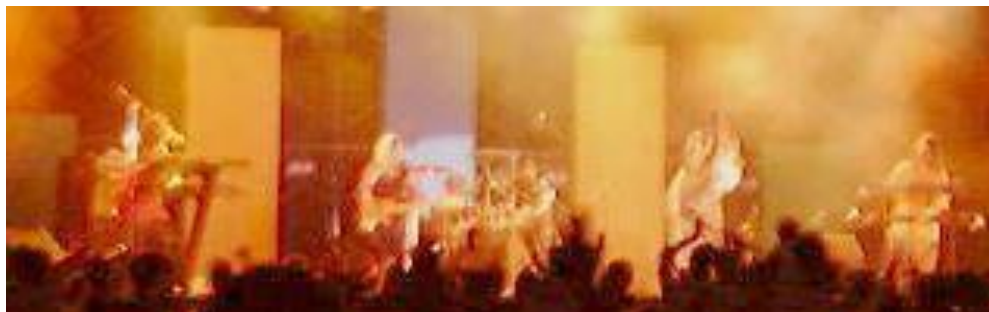
「舞台イメージ」 ※参考イメージです