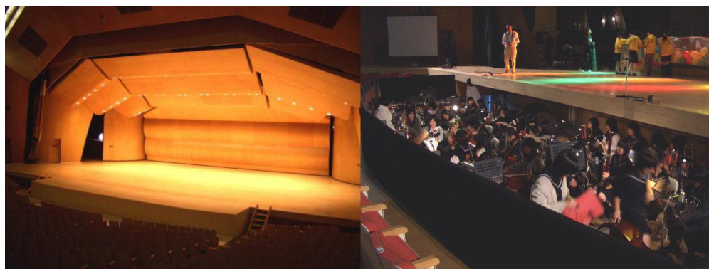
エプロンステージ