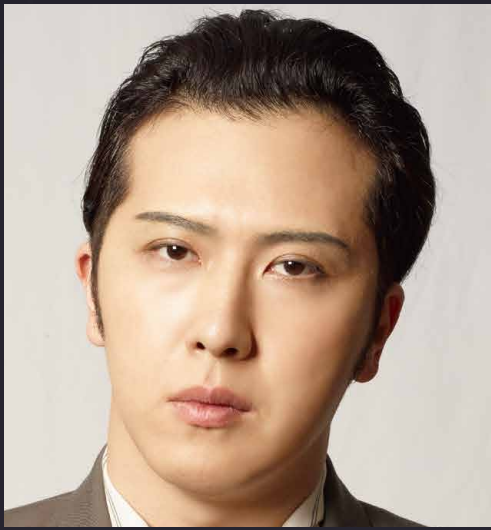
尾上松也 × 廣瀬友祐