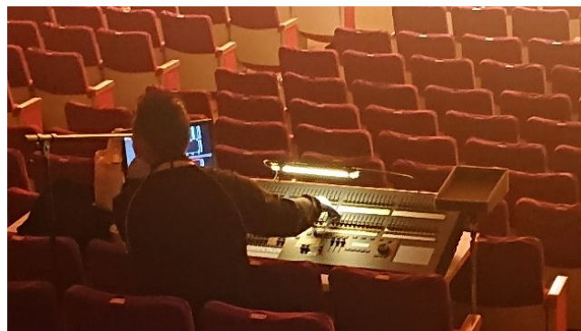
様々な舞台照明の説明をしています