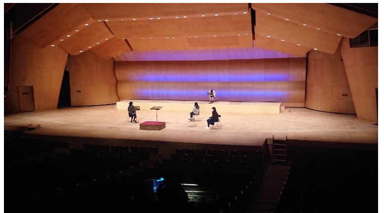
明るさによってイメージが変わります