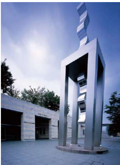
建島寛造 《WAVING FIGURE 光》 1993年 ステンレス 高さ12m 設置場所:正面玄関前