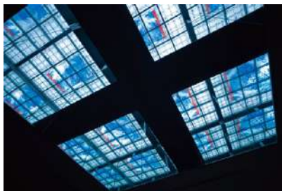
三ツ矢亮一 《BRIGHT SHOWER》 1993年 ステンドグラス 3m×3m 設置場所:2階ホールトップライト内