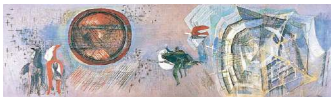
山口薫《朝昼晩》1955年 油彩 1.92m×6.56m 設置場所:ホワイエ