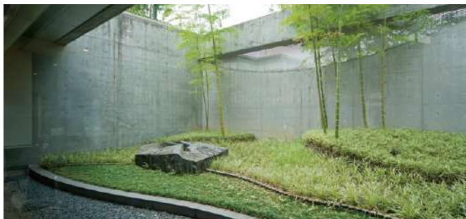
和南城孝志《光の山脈(やまなみ)》1993年 石材 2.8m×1.8m×0.65m 設置場所:光庭