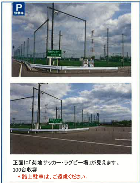
正面に「菊地サッカー・ラグビー場」が見えます。 100台収容 * 路上駐車は、ご遠慮ください。