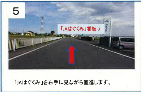
「JAはぐくみ」を右手に見ながら直進します。