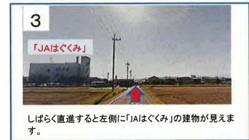
しばらく直進すると左側に「JAはぐくみ」の建物が見えます。