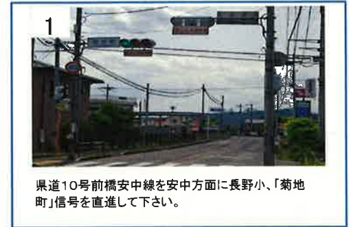
県道10号前橋安中線を安中方面に長野小、「菊地町」信号を直進して下さい。