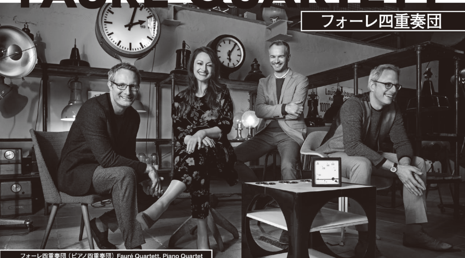
フォーレ四重奏団 (ピアノ四重奏団) Fauré Quartett, Piano Quartet