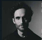
『スピーク・トゥ・ミー』 (ユニバーサルミュージック)

“現代ジャズ・ギターの最高峰”との呼び声も高い鬼才、ジュリアン・ラージがニュー・アルバム『スピーク・トゥ・ミー』のコア・メンバーであるホルヘ・ローダー（ベース）、デイヴ・キング（ドラムス）とのトリオで来日する。5歳でギターを始め、12歳でグラミー賞授賞式での演奏を行なうなど、幼少期よりギターの神童として注目を浴び、15歳でゲイリー・バートンのバンドに抜擢。『スピーク・トゥ・ミー』ではシンガーソングライターのジョー・ヘンリーをプロデューサーに迎え、フォーク、ゴスペルなどルーツ・ミュージックの要素も反映した独自の音作りに磨きをかけている。巨星ハービー・ハンコックに「心と意思と魂でプレイするミュージシャン」と称賛されたジュリアンの最新ステージを見逃すわけにはいかない。