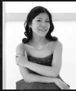
進藤 実優 Miyu Shindo

2002年に日本人として初めて第8回モーツァルト国際コンクールで優勝。いまや人気・実力ともに日本を代表するピアニストの一人である。2022年より毎年夏にJ.S.バッハのゴルトベルク変奏曲の全曲演奏会をおこなうほか、ピアノのソリストとしてウィーン国立歌劇場バレエ団の2026シーズンの2つのプロダクションに参加し、ウィーン国立歌劇場管弦楽団と計11公演で協奏曲で共演する。群馬県前橋市生まれ。故田中希代子、故林秀光の各氏に師事。桐朋学園女子高等学校音楽科卒業後、イタリアのイモラ音楽院に留学。CDに「J.S. バッハ：ゴルトベルク変奏曲」「モーツァルト：ピアノ協奏曲第20番、第21番」「子守歌ファンタジー」「ベートーヴェン：ピアノ協奏曲全集 Vol.1,2」などがあり、2026年3月18日には世界初録音を含む新CD「バレエ・ファンタジー」が出版される。2007年第17回出光音楽賞受賞。