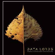
Maria Schneider Orchestra 『Data Lords』 (ArtistShare)