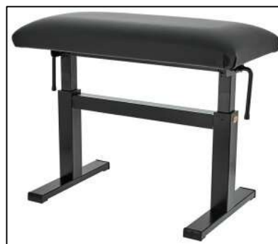
アンデクシンガー 484SN-01A