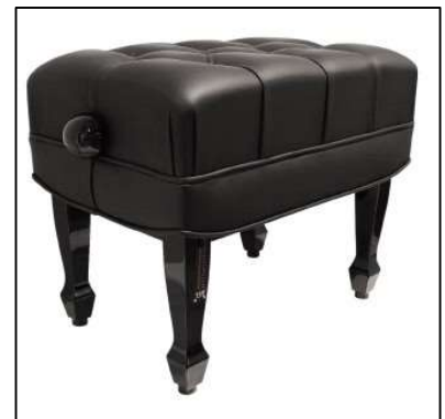
ファツィオリ オリジナルベンチ