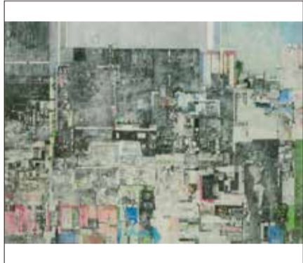
小林正《都市夜景》2024年 油彩・キャンバス 作家蔵

開催期間 ~6/21(日) 収蔵作品展 版画集ぜんぶ見せます! 同時開催 特集展示 小林正