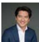
ユージン・ツィッゲル(指揮)

16:00開演(15:00開場) ④グラスノ2人のティンパニストと管弦楽のための協奏的幻想曲、ブルクナーノ交響曲 第7番 木長調 WAB 107(コールス版) ◎全席指定 SS席 7,500円 S席 6,500円 A席 5,500円 B席 4,500円 C席 3,500円 ※特別料金、U-25割引の設定有。群馬交響楽団事務局のみ取扱い