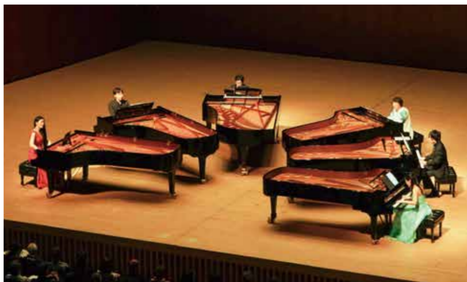
左から ヤマハ CFX(2台)、ベーゼンドルファー 290imperial、スタインウェイD-274(3台)▶